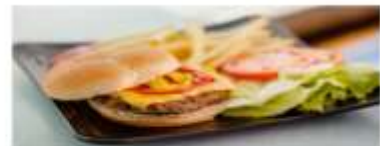
Casual Dining Savor a wide range of fresh food items and mouthwatering delicacies for dinner. View More