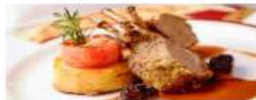
Adult-Exclusive Dining Enjoy romantic dinner destinations that cater exclusively to adults looking for fine dining amid an elegant atmosphere. View More