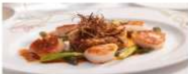
Main Dining Disney's Rotational Dining lets you "rotate" to one of 3 restaurants, while your servers follow you from venue to venue. View More