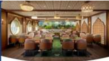
Gramma Tala Kitchen